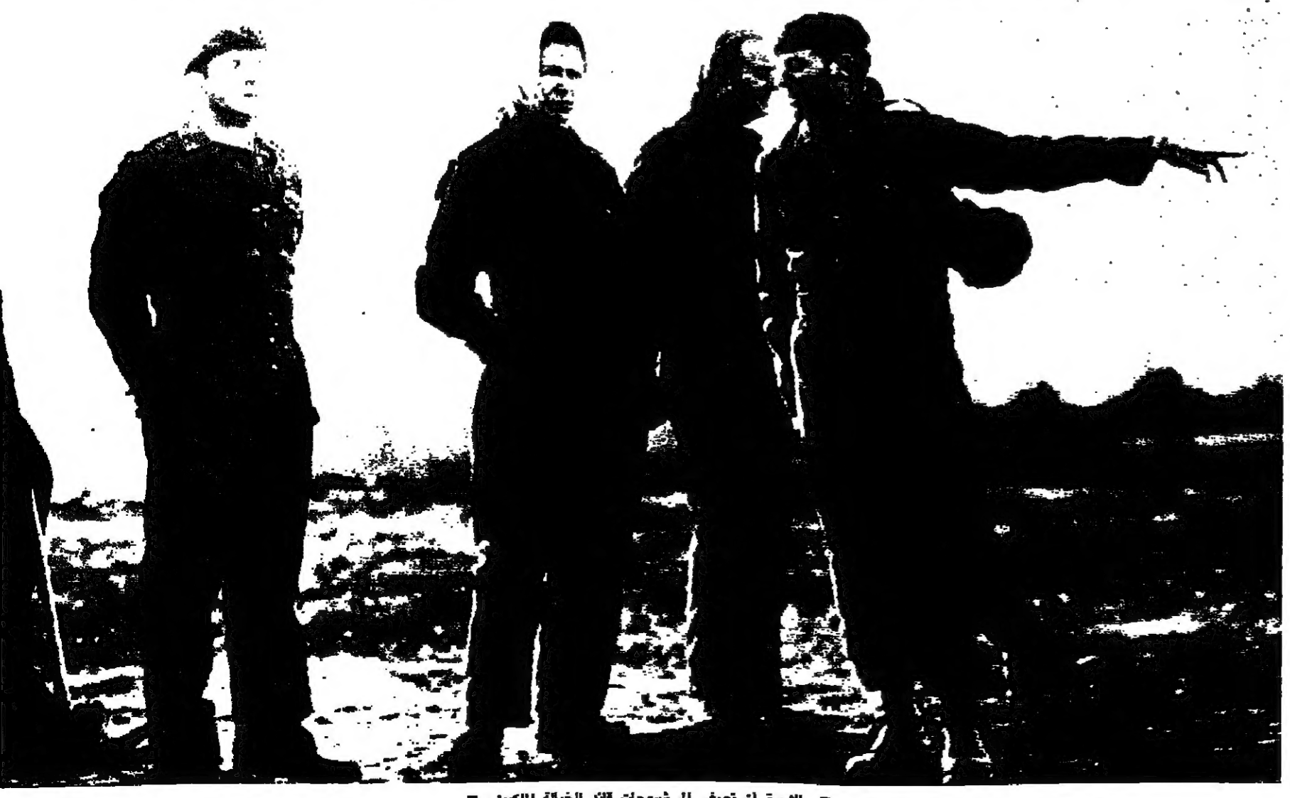
الاميرة ان تصفي الى شروعات قائد الخيالة المكسين